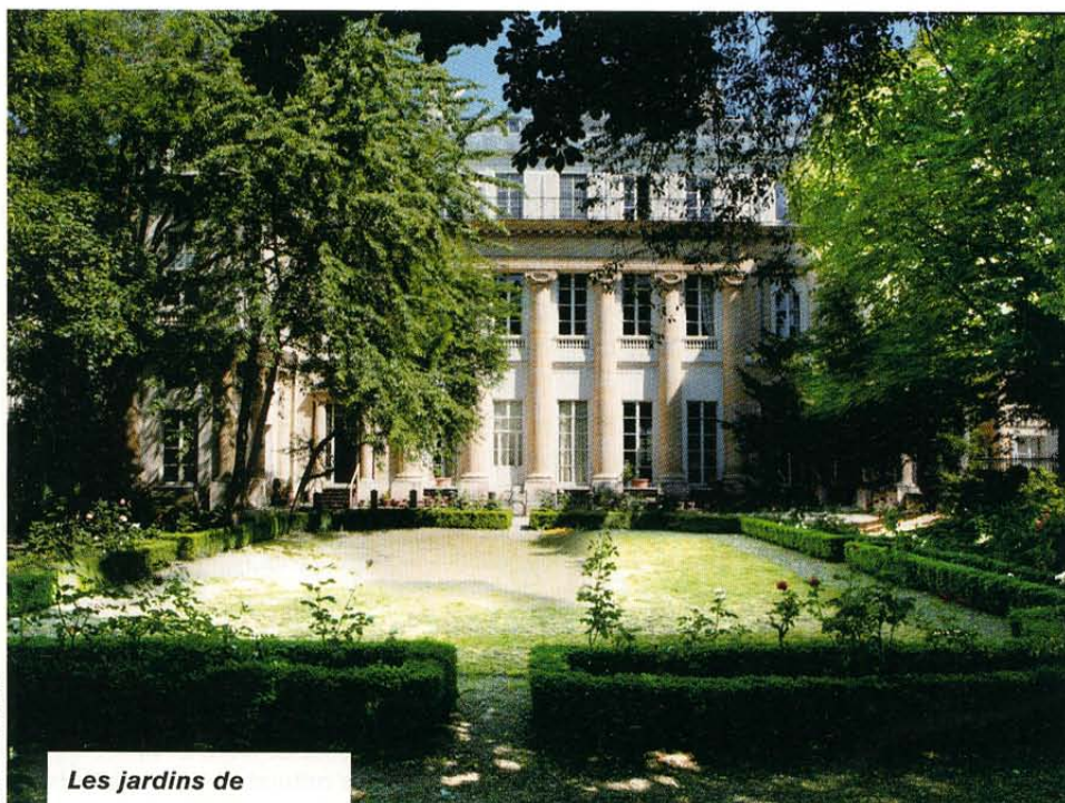
Les jardins de l'Istituto Italiano di Cultura, dans le VII e arrondissement.

Une initiative exemplaire qui rejoint l'intuition de Rockefeller au siècle dernier : promouvoir un dialogue entre tous les peuples et toutes les cultures. ■